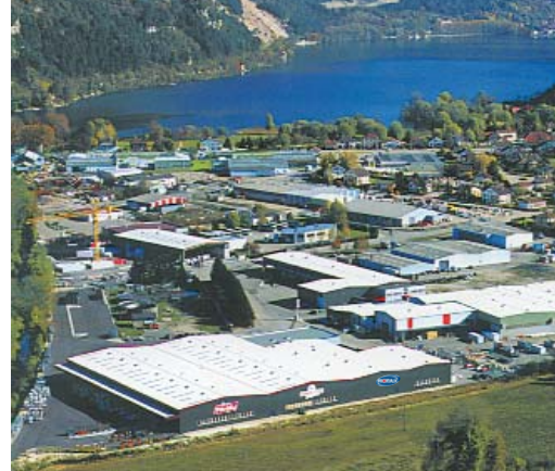
site de production du groupe Poralu à Port (01)

Rotax appuie son activité sur l'expérience du groupe Poralu, à capitaux français, disposant d'un site moderne de plus de 25 000 m 2 à Port. Rotax propose des prestations de haut niveau : capacités de production, bureau d'étude, logistique, achats, qualité. PMI dans un ensemble cohérent, collaborant sur des produits propres au groupe, Rotax affirme une indépendance propice à l'innovation et au respect des engagements souscrits auprès de ses clients. Respect des normes et de l'environnement complètent l'offre dans une démarche de développement durable défendue par le groupe.