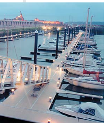
pontons et marinas