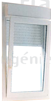
menuiseries particuliers et professionnels